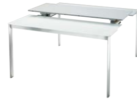
tavolo aperto con 2 allunghe cm 130 x 131 table opened with 2 ext. inch 51.2 x 51.6