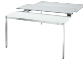
tavolo aperto con 3 allunghe cm 130 x 179 table opened with 3 ext. inch 51.2 x 70.5