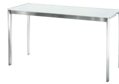
consolle chiusa cm 130 x 48 console closed inch 51.2 x 18.9