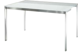
tavolo aperto con 1 allunga cm 130 x 83 table opened with 1 ext. inch 51.2 x 32.7